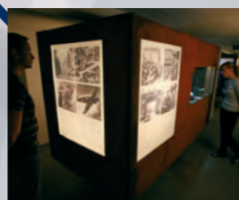
Bunker de la guerra mundial, exposición sobre la destrucción y la recons- trucción de la Fuggerei, acceso por la zona ajardinada