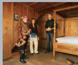
Museo de la Fuggerei, Mittlere Gasse 13 y 14